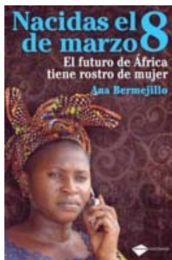
Portada del libro

Quince testimonios de emprendedoras africanas reflejan el esfuerzo diario por alcanzar el reto de la supervivencia y el desarrollo a través de un recorrido por lo más 'desconocido' y olvidado de Tanzania, Senegal, Namibia, Cabo Verde, Etiopía, Gambia, Marruecos y Mozambique: sus mujeres